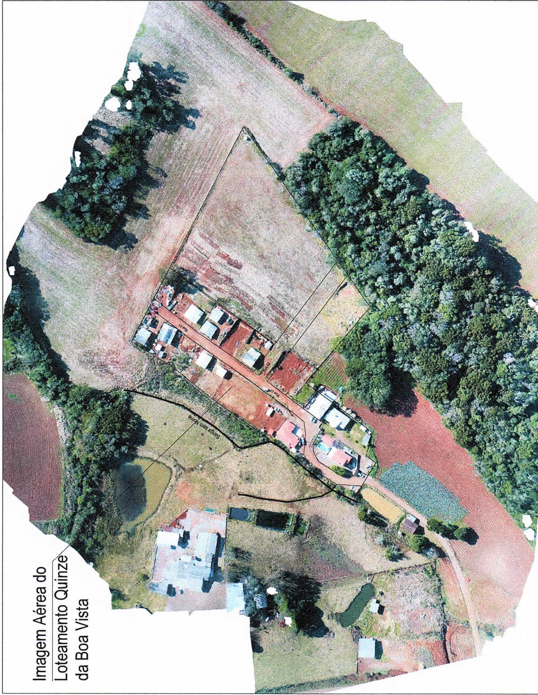
Imagem Aérea do Loteamento Quinze da Boa Vista

PREFEITURA MUNICIPAL DE IBIRAIARAS ESTADO DO RIO GRANDE DO SUL